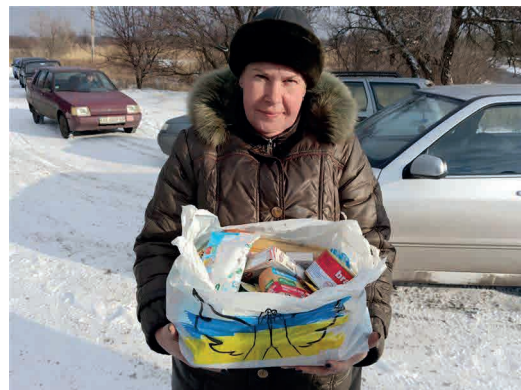
Distribution de biens de première nécessité par l'association Angel of Salvations.

Pour faire face à l'urgence dans l'urgence, suite à la destruction du barrage de Kakhovka en juin 2023, plusieurs partenaires ont reçu une aide exceptionnelle pour documenter les dégâts environnementaux, distribuer des aides alimentaires et de l'eau aux populations inondées et les évacuer en lieux sûrs.