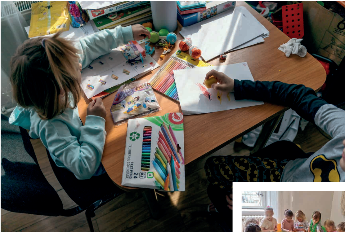
Le centre Hope and Homes accueille des enfant réfugiés en Roumanie.