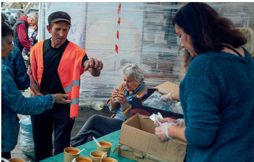
Distribution alimentaire à Lviv en Ukraine, organisée par World Central Kitchen.