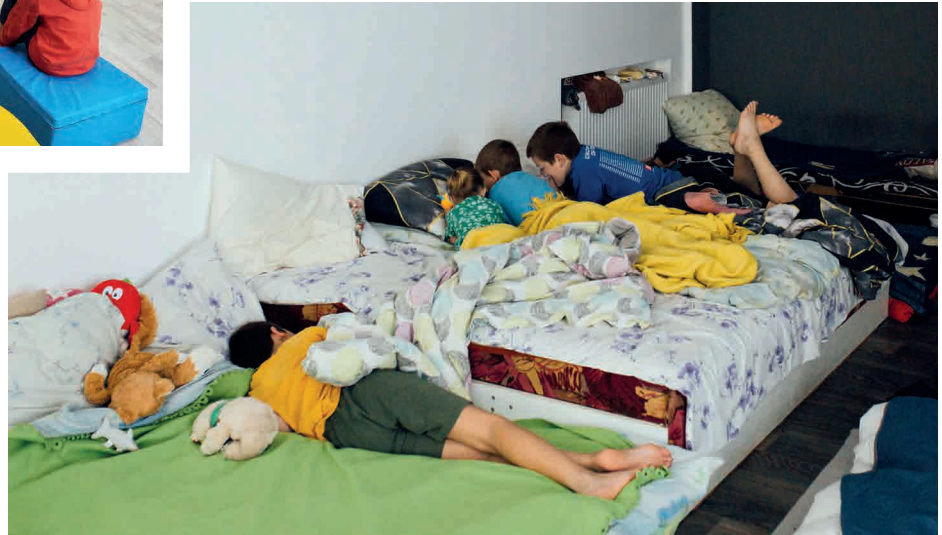
Centre d’accueil pour des populations déplacées ukrainiennes à Lviv, mis en place par Triangle Génération Humanitaire.