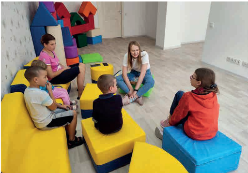
L’association Your support propose des séances de soutien psychosocial aux enfants déplacés à Lviv, en Ukraine.