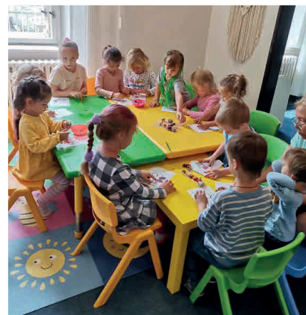
Le réseau Carpathian Foundations organise des activités pour l’intégration des réfugiés ukrainiens dans les écoles slovaques.