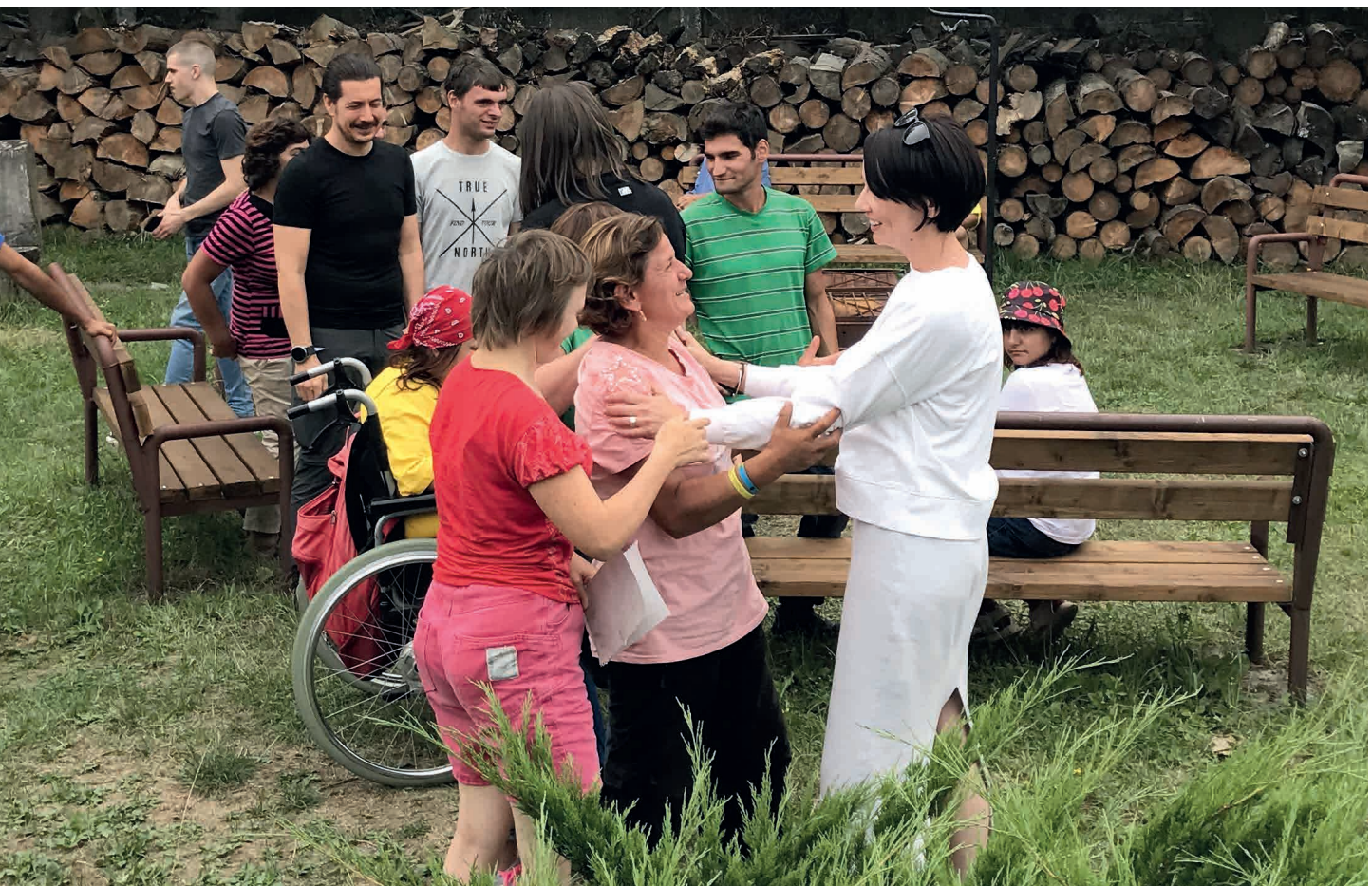
Le centre d'accueil Parasolka de CAM-Z permet aux personnes handicapées de la région de Tiatchiv d'accéder aux services médicaux, à une éducation spécialisée et à des activités génératrices de revenus.

Enfin, parce que la question de l'accueil des réfugiés concerne plusieurs pays, le réseau des Carpathian Foundations (Slovaquie, Hongrie et Ukraine) agit à l'échelle européenne. Elles déploient des actions de communication à destination du grand public, pour lutter contre les préjugés au sujet des réfugiés ukrainiens et apportent des aides matérielles et financières aux organisations locales impliquées auprès des plus vulnérables.