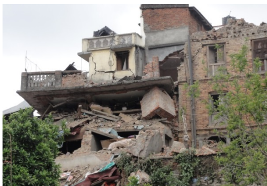
Maison partiellement détruite, village de Khokana, 2015, ©Fondation de France

Les fonds sont distribués au fur et à mesure de l'avancement des projets, pour les accompagner dans la durée et renforcer leur impact auprès des populations en termes de résilience.