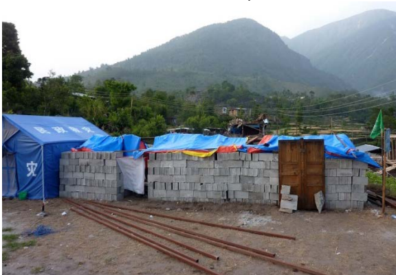
La reconstruction en cours, Kot (Vallée de Thangpal)