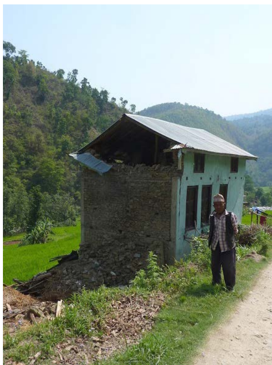
Maison partiellement détruite, Sindhupalchok, 2015

86% de cette somme finance les projets menés par des ONG, et 14% couvre les frais.