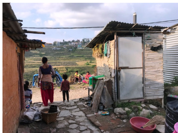
Les abris temporaires d'Enfance Népal, conçus pour résister au temps

A partir de la 2 e année, la Fondation de France a mis la priorité sur des projets de reconstruction durable et de long terme, qui intègrent l'amélioration de la qualité et de la solidité des bâtiments, la prévention des risques environnementaux, la formation et la participation des habitants, l'utilisation des matériaux locaux et le respect des modes de vie des communautés.