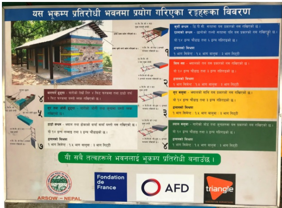
Panneau explicatif, construction de maisons modèles antisismiques par ARSOW, Gunsa ©Fondation de France, 2018

sur la reconstruction durable des maisons individuelles. Les partenaires TGH/ARSOW Nepal (photo ci-dessous) créent ainsi des « maisons modèles » que les habitants peuvent reproduire ou adapter en fonction de leurs besoins et de leurs moyens.