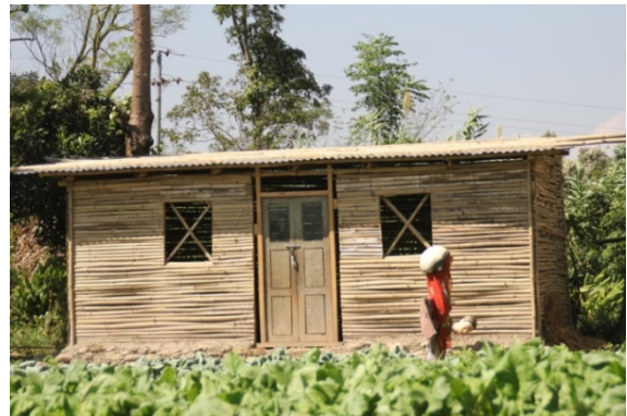
Abri temporaire par Enfance Népal, ©Fondation de France, 2016

Le projet de reconstruction porté par Enfance Népal, dans le village classé de Khokana, a permis la construction de 165 cottages en matériaux locaux, dotés de latrines (privatives ou collectives) et de réservoirs d'eau. Ces cottages, censés être temporaires sont aujourd'hui une référence pour les populations de la zone : ils ont été construits très vite après le séisme et sont encore en très bon état, 3 ans après leur construction. Les familles qui souhaitent reconstruire une maison plus durable peuvent, de plus, utiliser les matériaux des cottages à cet effet.