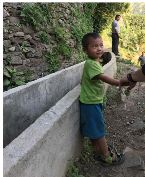
Canal d'irrigation reconstruit TGH/ARSOW, Dhap (Vallée de Thangpal)