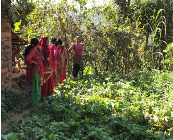
Jardin maraîcher, Coopérative de femmes (Dhading), NACCFL