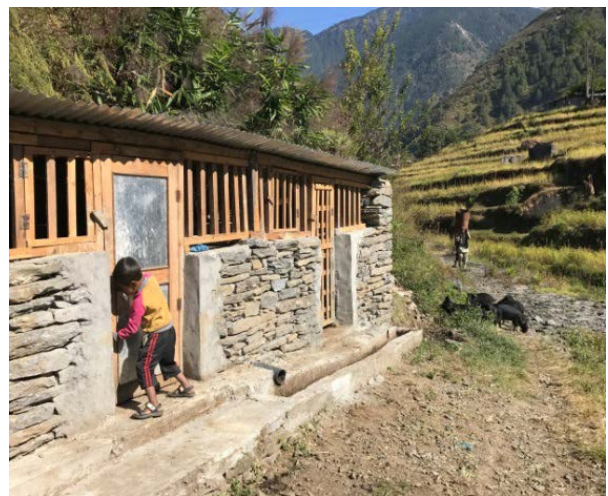
Porcherie (Gunsa), TGH/ARSOW ©Fondation de France 2017

Diverses formations professionnelles ont également été proposées aux personnes affectées : plantation de thé, production de compost, petit élevage, mais aussi gestion d'entreprise, menuiserie ou couture. Ces actions contribuent non seulement à fournir des revenus à court terme mais aussi à ouvrir de nouvelles opportunités économiques à moyen et long terme, renforçant la résilience des populations.