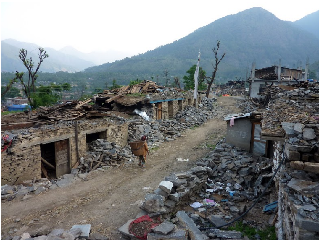
Village de Gunsa, 2015

A l'occasion des 3 ans de la catastrophe, retour sur les actions engagées.