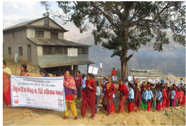
Marche dans le cadre des « 16 jours contre les violences faites aux femmes », Planète Enfants & Développement