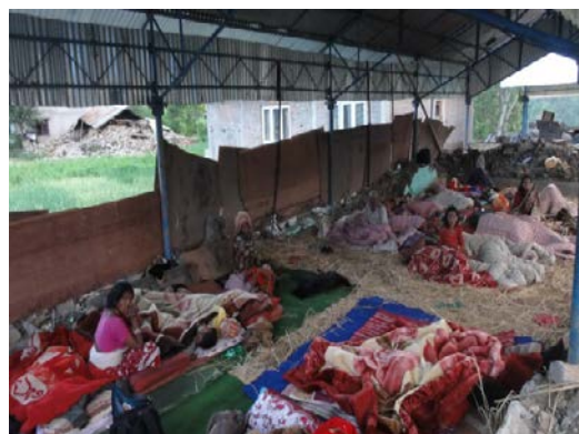
Abris de fortune, village de Khokana, 2015

Capitalisant sur le dynamisme de la société civile népalaise, priorité a été donnée aux projets portés par des associations locales, parfois appuyées dans leur organisation par des partenaires français.