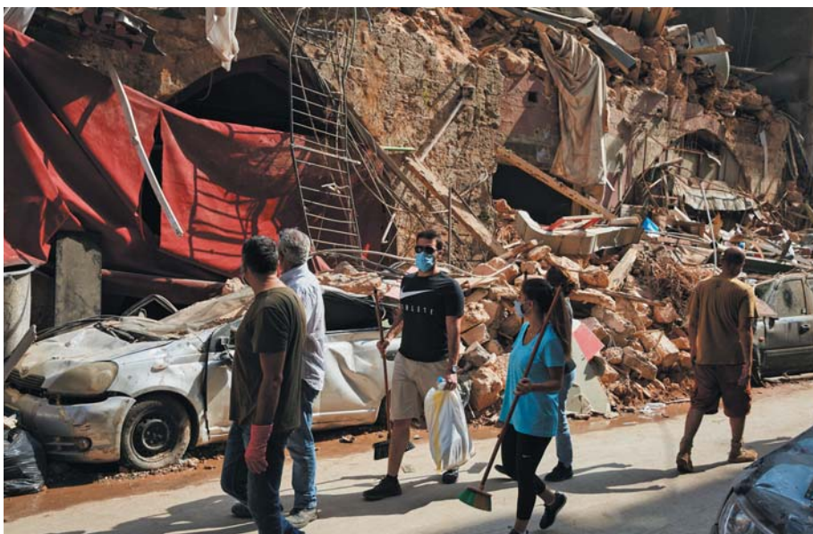
Des volontaires de la société civile déblaient les gravats dans la rue principale du quartier Gemmayze, un des plus touchés par l'explosion.

Des efforts considérables ont été déployés par la Fondation de France et ses partenaires pour que la réponse apportée soit à la fois rapide, efficace et durable, tout en gardant à l'esprit les enjeux propres à toute intervention au Liban. Au 31 janvier 2021, soit près de 5 mois après l'explosion, la Fondation de France a ainsi pu identifier et soutenir 31 projets pour un montant total de 1 455 500 euros, sur quatre volets jugés prioritaires.