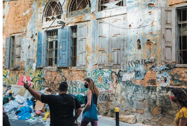
Karine Meaux, responsable du programme Solidarité Liban, en mission à Beyrouth, le 20 octobre 2020.

Sur le plan sanitaire enfin, le Liban fait face, comme tous les pays du monde, à l'épidémie de Covid-19, et ses infrastructures hospitalières et sanitaires sont soumises à une tension chaque jour plus grande.