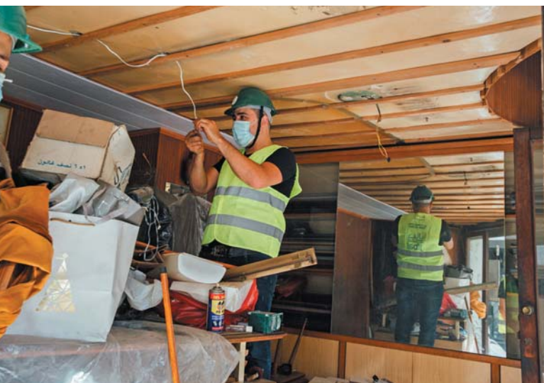
Un électricien répare bénévolement les boutiques des petits commerçants, avec les organismes Jibal et ATB.