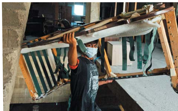
L'association Arcenciel, qui gère un atelier de menuiserie, répare les meubles des particuliers.