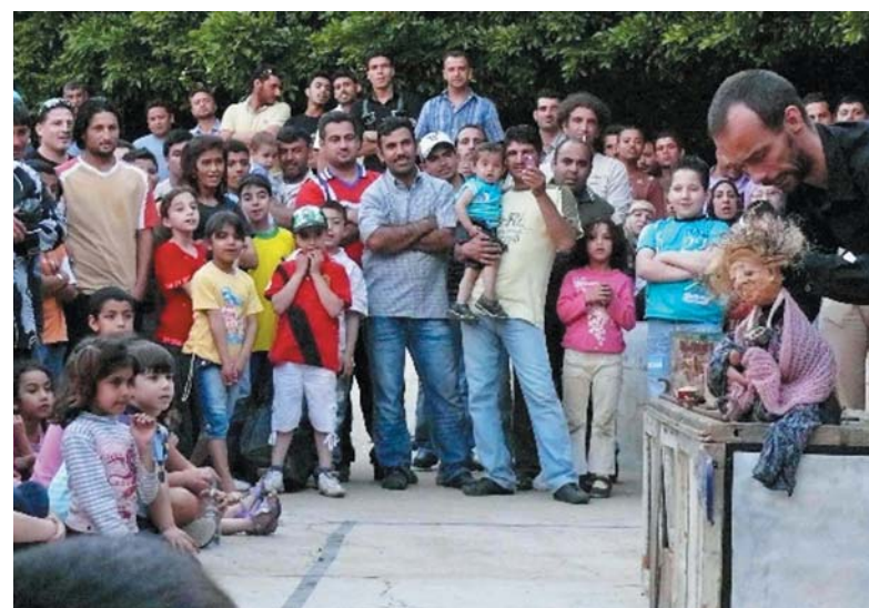
Le projet « Compagnons de route » porté par Hammana Artist House est une invitation pour les enfants à regagner confiance et à réapprendre le plaisir des petites choses de la vie.

Nous sommes particulièrement touchés par ce vaste élan de générosité.